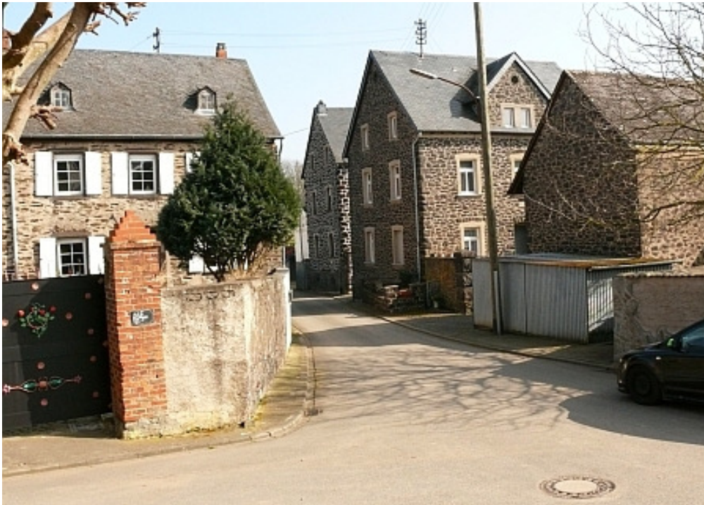
Die Erbhöfe Wey (rechts im Bild) und Schmitt (dahinter) am Ende der Burgstraße heute