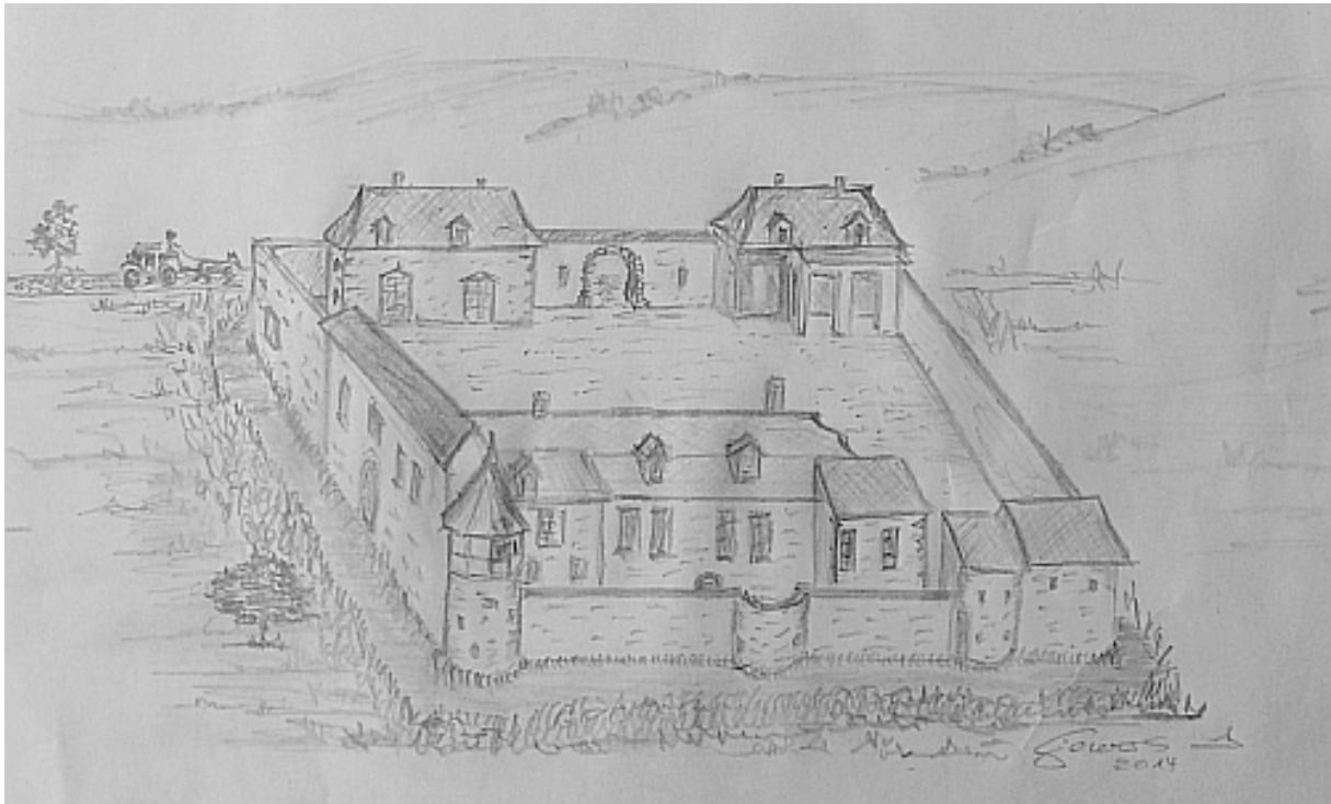
Der Naunheimer Burghof im 18. Jahrhundert (gezeichnet nach einer Miniatur von Ulrich Siewers)

Der Burgfrieden und der dazu gehörige Burghof waren im 18. Jahrhundert kurtrierischer Besitz. Er wurde von den Grafen von Metternich verwaltet, die in Koblenz residierten. In ihrem Auftrag besorgten Pächter (Hofmänner) die Landwirtschaft auf Burg Naunheim.