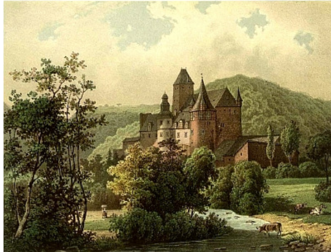
Zeitgenössische Abbildung von Schloss Bürresheim um 1860

Von hohen Bergwäldern umgeben, wacht vier Kilometer nordwestlich des Eifelstädtchens Mayen majestätisch und einsam auf einem hohen Felssporn Schloss Bürresheim über die Talaue an der Einmündung des Nitzbachs, vom murmelnden Wasser der Nette umspült.