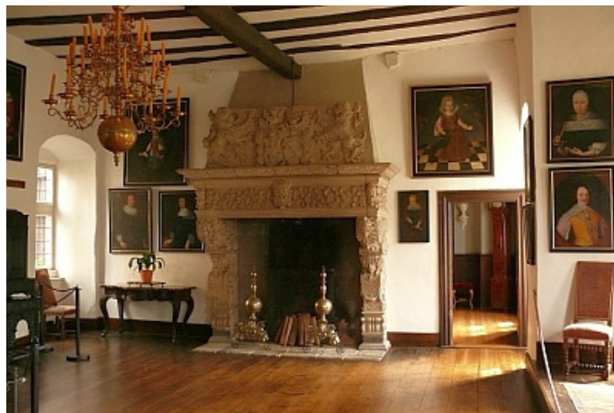
Der Ahnensaal des Schlosses

1948 gelangte Schloss Bürresheim in den Besitz des Landesamts für Denkmalpflege Rheinland-Pfalz, ehe die Verwaltung der staatlichen Schlösser Rheinland-Pfalz (heute: Burgen, Schlösser Altertümer Rheinland-Pfalz) die Betreuung übernahm. Im Rahmen einer Führung können Besucher wesentliche Teile der historischen Gebäude besichtigen. Die einzigartige Innenausstattung umfasst Stücke aus der Spätgotik bis hin zum Historismus. Zahlreiche Porträts zeigen Mitglieder und Verwandte der Besitzerfamilie und Fürsten vergangener Zeiten. Die Originalität des Inventars ist dem glücklichen Umstand zu verdanken, dass Bürresheim über eine lange Zeit in der Hand einer einzigen Adelsfamilie war. So blieb sie bis in unsere Tage als ein einmaliges Zeugnis rheinischer Adels- und Wohnkultur erhalten.